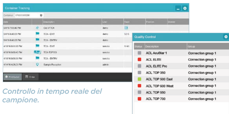
Controllo in tempo reale del campione.