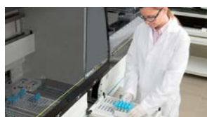
Modulo Ex Flex